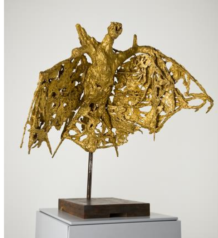
Germaine Richer – La Chauve-souris – 1946 Collection Musée Fabre Montpellier