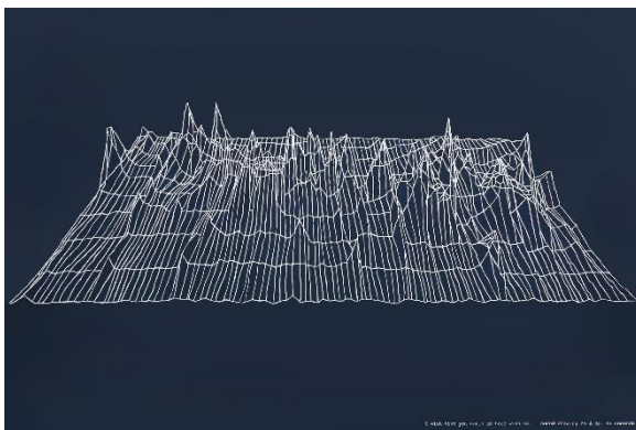
Graham Gussin, I Wish that you Could Be Here with Us , 1995, dessin mural, dimensions variables. Coll Frac Occitanie Montpellier