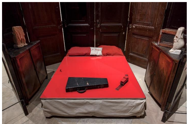
Louise Bourgeois – Red Room (Parents) – 1994