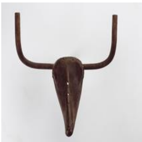
Pablo Picasso – Tête de Taureau – 1942

Références : Voyage à poubelle plage de E. Brami et B. Jeunet paru aux Seuil en 2006.