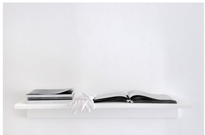
Nicolas Daubanes – Les livres noirs – 2016 Coll Frac Occitanie Montpellier