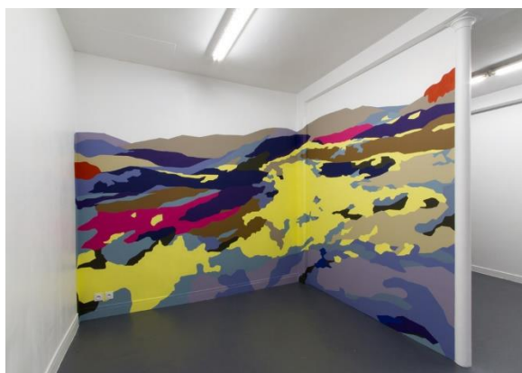
Pablo Garcia – Paysage d'événements (Craonne) – 2015 - Coll Frac Occitanie Montpellier

En Art Danse : un parcours dansé à partir de prélèvement de gestes liés au travail, au souvenir, à la mémoire.