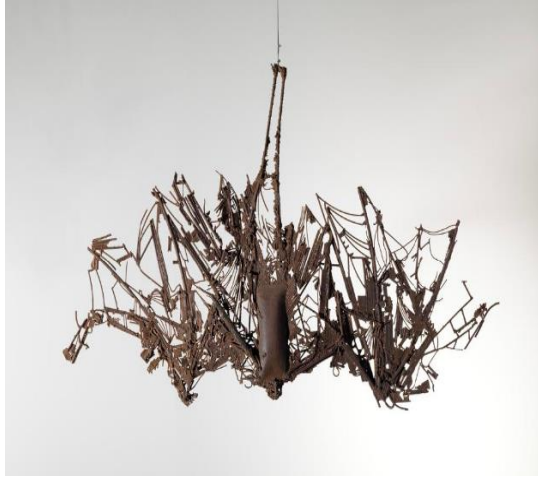
César – Chauve-souris – 1954 Collection Centre G Pompidou