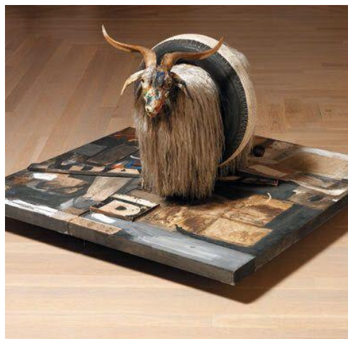
Robert Rauschenberg – Monogram – 1955-1959, mixed mediums with taxidermy goat, rubber tire and tennis ball. Moderna Museet, Stockholm