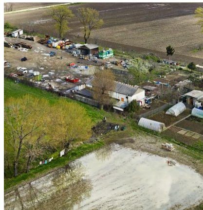
Mabel Palacin - Hinterland - 2009 Coll Frac Occitanie Montpellier