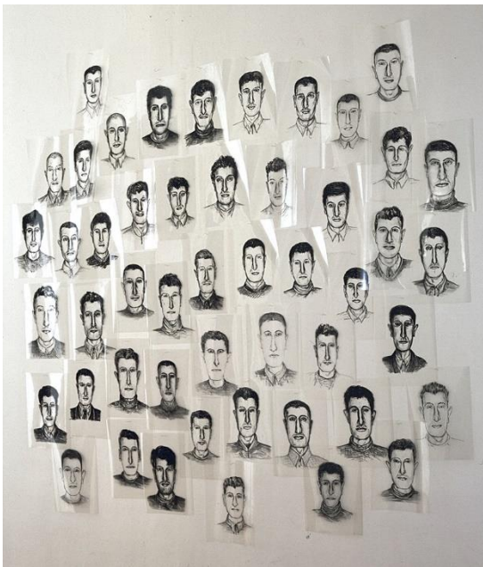
Maurizio Cattelan – Il Super Noi – 1993 Coll Frac Occitanie Montpellier