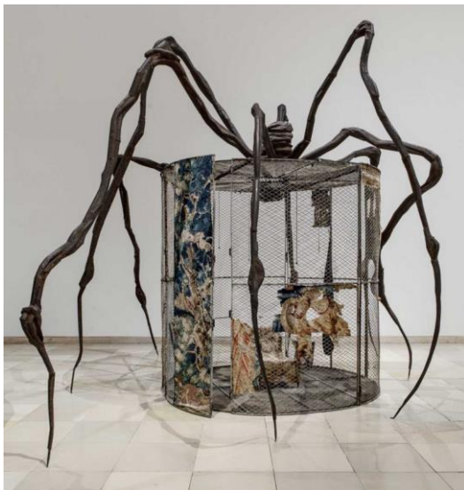
Louise Bourgeois – Spider – 1997

Situer-Relier des caractéristiques d'une œuvre d'art à des usages ainsi qu'au contexte historique et culturel de sa création.