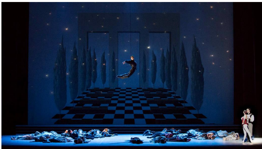
La chauve-souris , 1979, ballet de Roland Petit, © Yasuko Kayegama

Geoffrey Badel propose une série de dessins autour d'un animal que l'on pense fantastique ou bien encore maudit, mais dans tous les cas que nous connaissons mal. Homme et animal se mêlent dans des représentations au trait, sorte d'anthropomorphisme énigmatique. Les traits, représentant les ondes émises par l'animal, ressemblent à des strates, des représentations géographiques d'un visage.