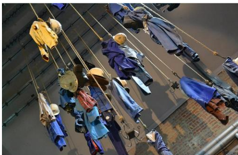
Salle des pendus de la mine de Lewarde

L'œuvre de S. Van Melick se présente sous la forme d'installation composée de tuyaux de cuivre, faisant référence au « carottes » d'un forage, donc au monde du dessous, et de restes de terril qui renvoient aux entrailles de la terre, à la mine. Sur ces tuyaux, l'artiste a gravé à l'eau forte des portraits de mineurs, trouvés dans des archives dans le nord de la France. Des voix s'élèvent des tubes dans différentes langues pour témoigner de leur vie passée dans les mines. Ces enregistrements ont été réalisés dans les langues maternelles des mineurs, ce qui rend à la fois cette œuvre proche et intimiste et lointaine. Le souvenir de ce travail qui n'existe plus se perdant dans une langue inconnue pour la plupart d'entre nous, et qui nous met dans la peau du mineur découvrant la France et ne comprenant pas son langage.