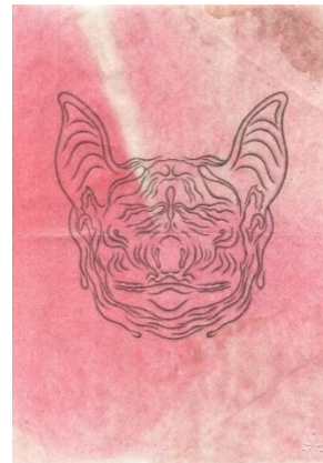
C Cédric Eymenier

Geoffrey Badel propose une série de dessins autour d'un animal que l'on pense fantastique ou bien encore maudit, mais dans tous les cas que nous connaissons mal. Homme et animal se mêlent dans des représentations au trait, sorte d'anthropomorphisme énigmatique. Les traits, représentant les ondes émises par l'animal, ressemblent à des strates, des représentations géographiques d'un visage.