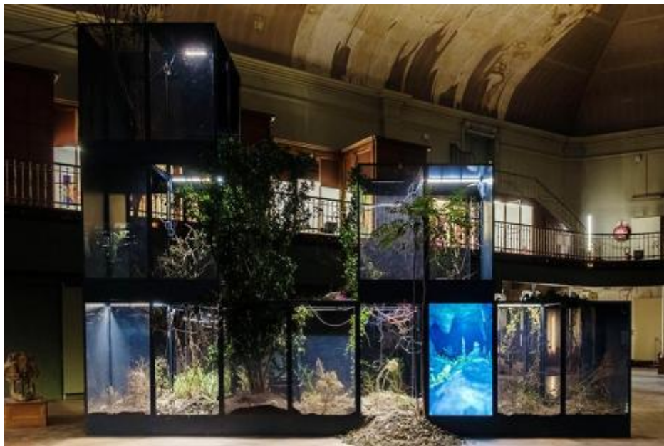
Ugo Schiavi, Grafted Memory System , 2022, vue de l'installation au Musée Guimet de Lyon.