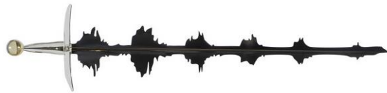
Le gentil garçon, Le propre de l'homme , 2008, Collection Frac Occitanie Montpellier

Afin d'approfondir les recherches sur ce thème, on peut s'appuyer sur l'article :